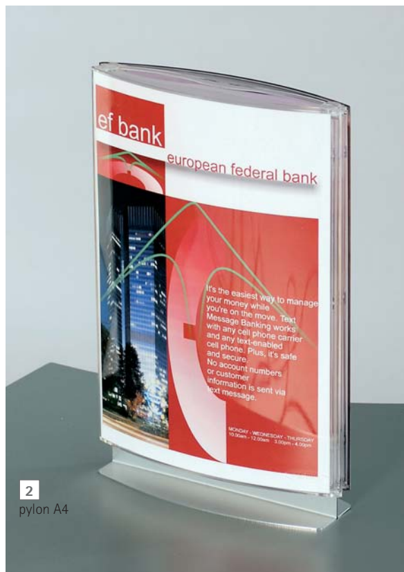
2 pylon A4